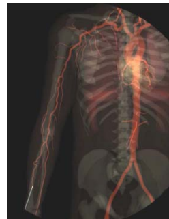
心臓カテーテル インターベンション体験