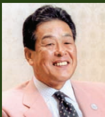
村田 兆治 むらた ちょうじ プロ野球解説者・元プロ野球選手 1949年広島県生まれ。1967年ドラフト1位で東京オリオンズ(現・ロッテ)入団。23年間で215勝。数々のタイトルを獲得。野球評論家、講演や野球教室でも活躍中。