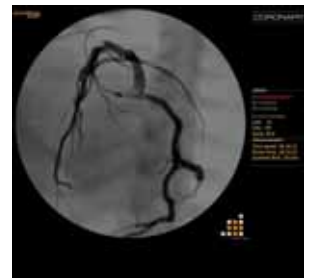
心臓カテーテル インターベンション体験