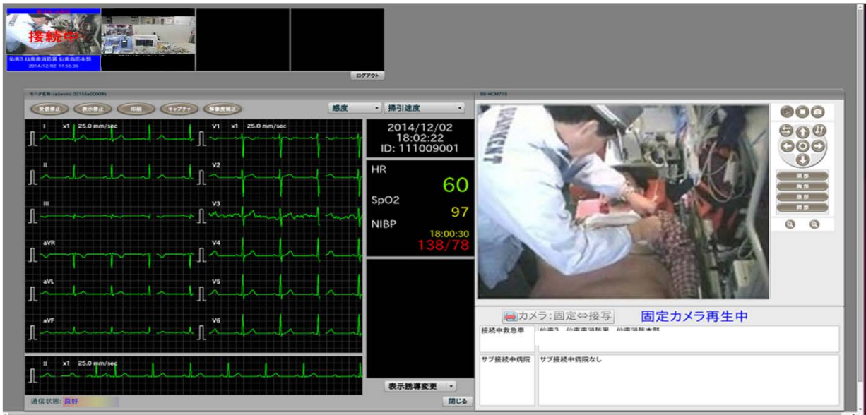
図2. 病院へ伝送された12誘導心電図と車内映像

12誘導心電図伝送システムの配備は、急速に全国的に広がっており、既に市内全救急隊への配備を完了した横浜市などでは、病院到着から治療までの時間が20～30分大幅に短縮されたと報告されています（図3）。